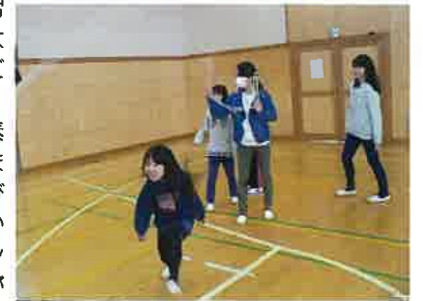
おおなわの練習風景

場所の都合で12の班を2つに分け、それぞれ週2回だけの練習ですが、なわの音がだんだん調子よく続くようになってきました。続けてたくさんとべるようになることは、子どもたちにとってとても嬉しいことです。とべる回数を競い合うことと、練習で自分たちの記録を伸ばすことの2つを目標に、子どもたちは一生懸命がんばっています。様々な活動と一緒に取り組んできたなかよし班活動に、この「なわとび大会」を通してもう一つ良い思い出が残ることと思います。