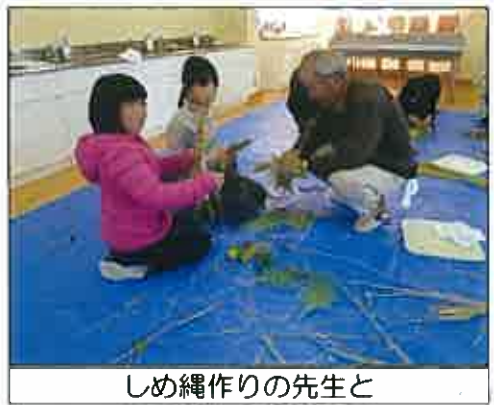
しめ縄作りの先生と

去る18日には、地域教育協議会、京丹波町ふるさと資料館運営委員会の皆様に、5年生がしめ縄作りを教えていただきました。わらはもちろんですが、松葉、ゆずり葉、うらしろ、南天の実等、様々な材料をご準備いただき、全員が大変立派なしめ飾りを作り、誇らしげに持ち帰りました。新年、5年生の各家庭には、手作りのしめ飾りがかけられ、あたりには一層清々しい空気が満ちていることと思います。