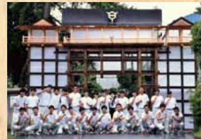
平成28年 『清水の舞台』