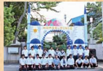
平成22年 『ブルーモスク』