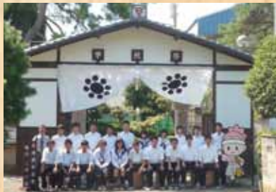
平成25年 『会津武家屋敷』