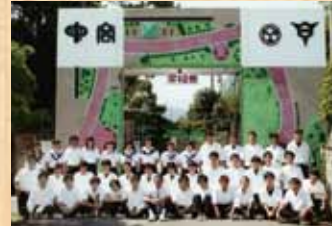
平成15年 『宮高100周年記念庭園』