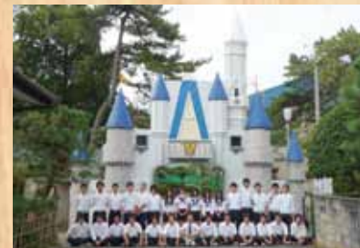
平成21年 『シンデレラ城』