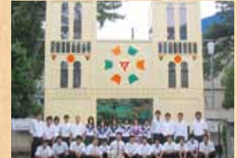
平成18年 『ノートルダム寺院』