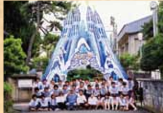
平成13年 『サグラダ・ファミリア』