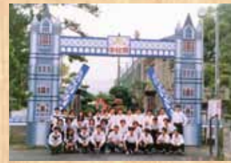
平成9年 『ロンドン・ブリッジ』