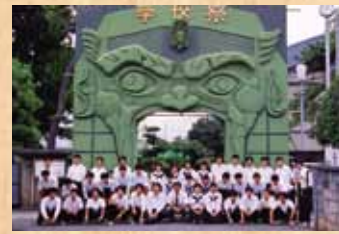
平成11年 『パラッツォ・ズッカリ』