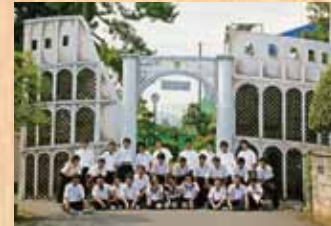
平成16年 『コロセウム』