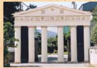
平成8年 『パルテノン神殿』