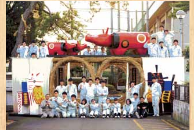
令和3年 『コロナの収束』