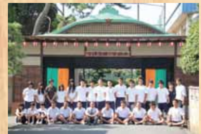
平成24年 『柳橋歌舞伎伝承館』