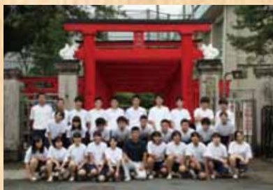
平成29年 『三十五ノ宮千本鳥居』