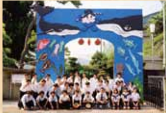
平成12年 『豊かな海づくり大会』