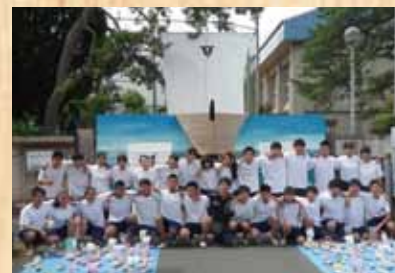
平成30年 『北前船の寄港地』