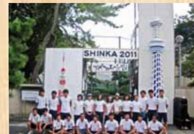
平成23年 『東京スカイツリーと東京タワー』