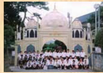
平成10年 『タージ・マハル』