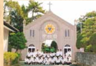
平成17年 『カトリック宮津教会』