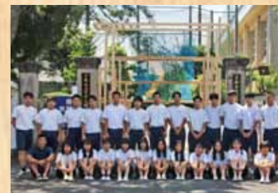
令和2年 『天かける橋』