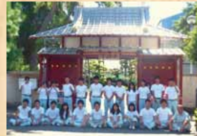
平成26年 『平等院鳳凰堂』