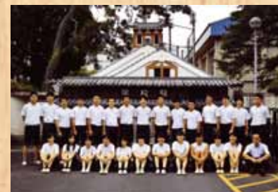
令和元年 『福知山城』