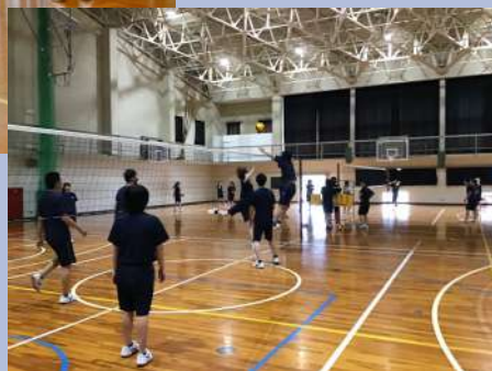
<バレーボールの様子→>