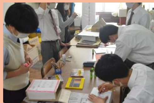
＜回収BOXを作る生徒会メンバー＞

活動に制約がある中で何ができるのかを常に考えながら、少しずつでも自分たちができることから取り組んでいます。