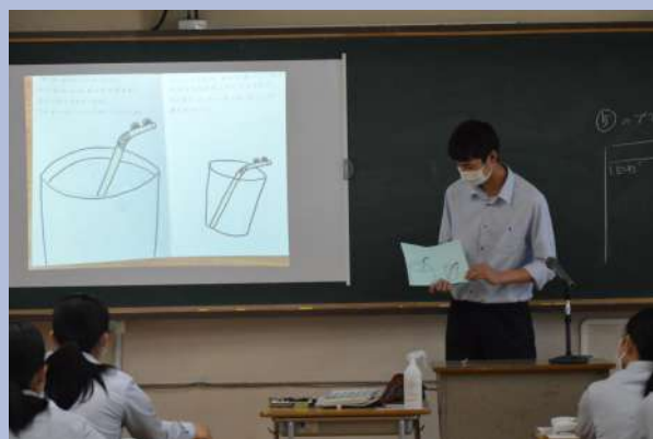
<作った絵本をクラスで披露する生徒>

1 年生は、2学期に地域のお母さんと赤ちゃんを学校にお招きして、赤ちゃん交流を予定しています。(新型コロナウイルス感染症の感染状況のみて、最終決定を行います。) それに向けて、赤ちゃんたちに手作りの絵本をつくり、読み聞かせをする計画をしています。