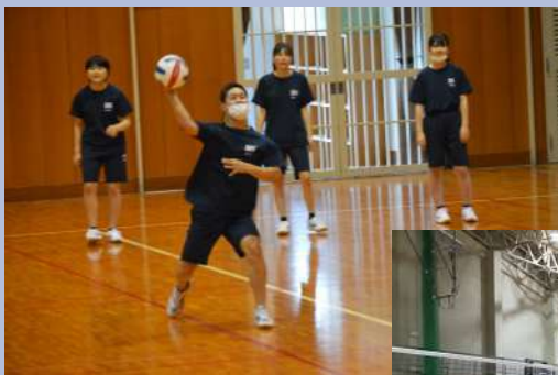
<↑ドッジボールの様子>

企画から進行を含めた運営のすべてを生徒たちが行いましたが、どちらの競技も大きなトラブルもなく、各競技盛り上がりを見せていました。日頃の学校生活では見ることのない、クラスメイトの意外な姿や活躍を見る機会にもなり、目的どおりクラス間交流、クラス内の団結力を高めることができる機会となりました。