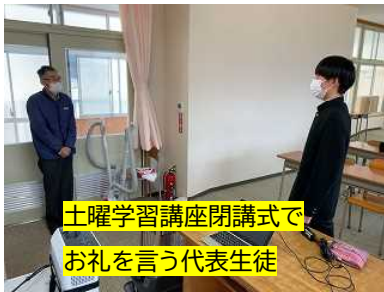
土曜学習講座閉講式で お礼を言う代表生徒

先月中旬までに実施された公立高校中期選抜等で、3年生28名のうち16名が進路を確定しています。16名の中には、前期選抜でしか受験できない学科(定員の全てを選抜する学科)を受検した生徒が全て含まれており、全員の第一志望達成につながる好結果でした。3月8日(月)の前期選抜に挑む12名は、当日まで体調管理をして、落ち着いて試験に臨んでくれたらと考えています。プレッシャーや不安はあると思いますが、しっかりと力を発揮できるようコンディションを整えてほしいと思います。