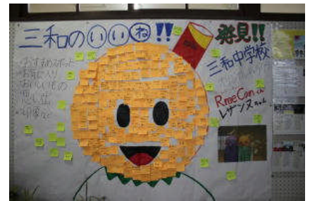
完成した「三和のいいね」

「My Own Road」「地球星歌」の2曲を歌い上げました。また、 今年、合唱の前に三和八幡太鼓と韓国芸能サムルノリのコラボ演奏を披露いたしました。