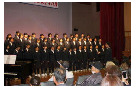
会場案内スタッフ

私は、本部の仕事をお手伝いしました。パンフレット配りではお客さんに積極的に話しかけ配ることができました。放送の仕事では、自分たちで原稿をつくり紹介や案内ができました。スタッフの方とも話をしたりすることができとても楽しかったです。