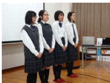
【生徒の感想より(抜粋)】

一番印象に残ったのは、「おしゃれ=自分目線、身だしなみ=相手目線」という言葉です。