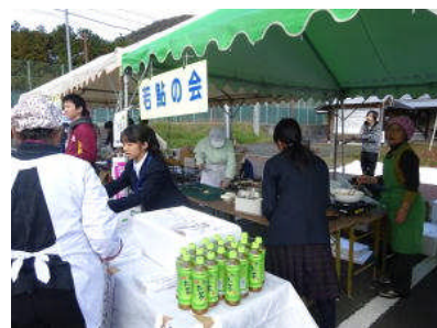
【昨年の三和フェスより】

授業参観をいただいた後の懇談会では、学校からの現状報告、意見交流を行いました。その中では昨年の『三和フェスティバル』に中学生がスタッフとして参加したことが好評であったなどの意見を頂戴しました。