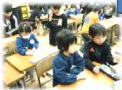
こども園体験入学