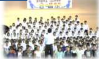
合唱祭に6年児童参加