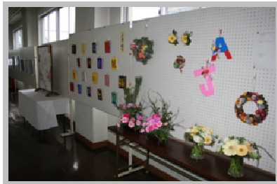
↑手前から、フローラルアート・華道、芸術科(書道)