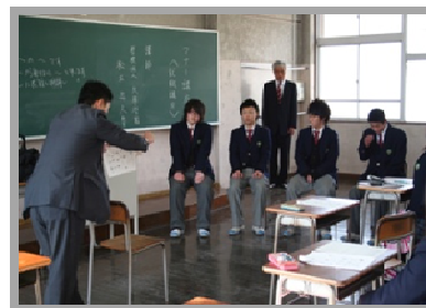
↑熱心に指導していただきました