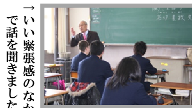
→いい緊張感のなか で話を聞きました

2年生を対象に「マナー講座」を行い、外部講師の方をお招きして挨拶や立ち居振る舞いについて指導していただきました。普段の言動を見直すほか、進学・就職時の面接における振る舞いなどに役立ててほしいです。