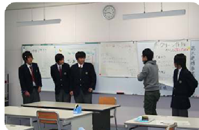
↓話し合った内容を皆の前で発表

はじめに「アフリカ（ナイジェリア）からみる地球環境問題」をテーマにした講演、その後、4グループに分かれて、小学生に対する環境学習プランについてのワークショップ（参加体験型学習）を行い、それぞれにテーマを決めて発表しました。