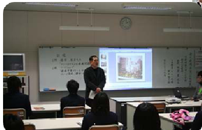
↓ナイジェリアの現状 について講演

農業科目「環境科学」で、高大連携の一環として、京都精華大学から板倉 豊 教授、学生スタッフをお招きして、出前授業を行いました。