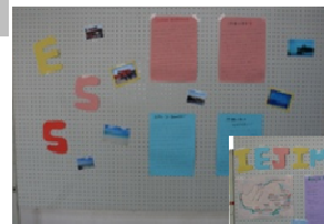
↓ESS「世界のバレンタインデー」 「沖縄」