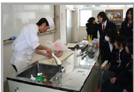
↑ヨコワの三枚おろしに 見入る様子

本校OBを中心に、さまざまな職種的第一線で活躍されている方々を講師としてお招きし、仕事内容のほか、体験談やアドバイスなどを話していただきました。