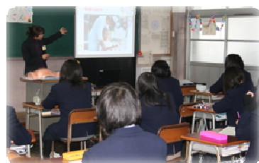
↓看護師のやりがい 聞いている様子