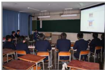
↑消防士の素晴らし さを聞きました