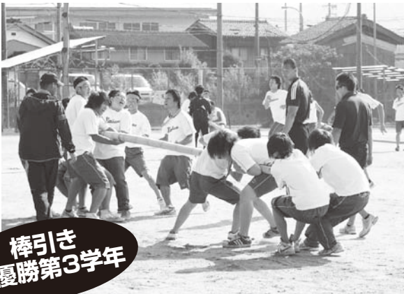
棒引き 優勝第3学年