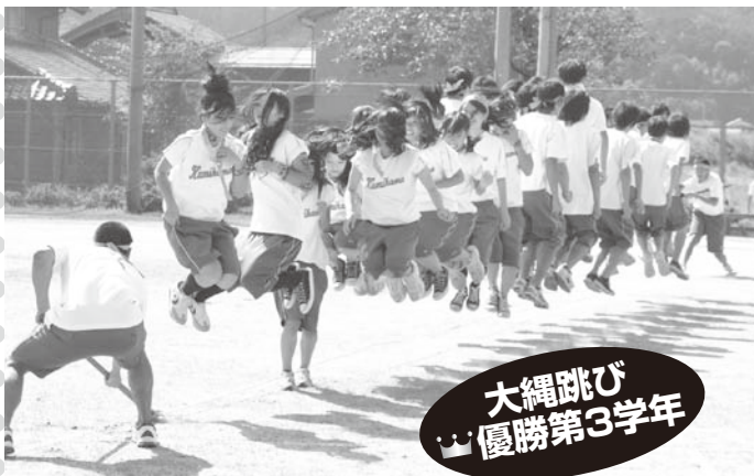
大縄跳び 優勝第3学年