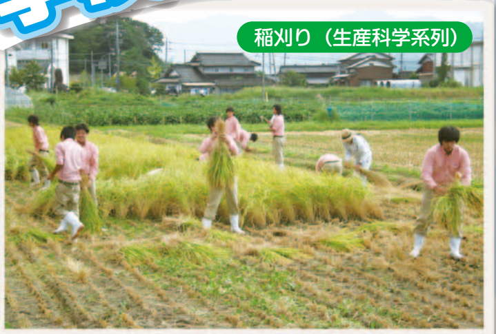
稲刈り (生産科学系列)