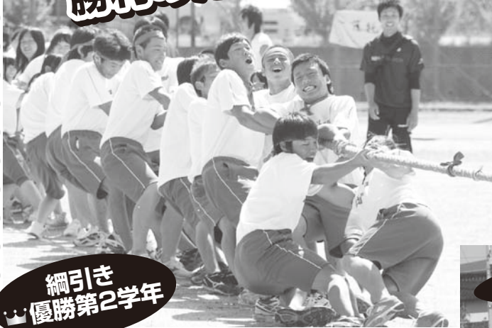
綱引き 優勝第2学年