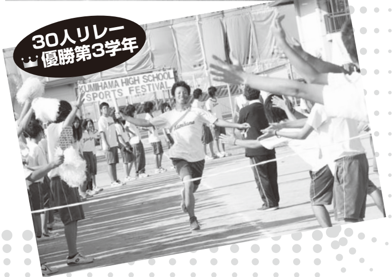
30人リレー 優勝第3学年