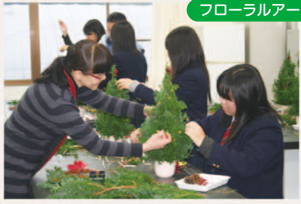
フローラルアート