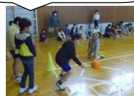
本部主催全校遊び

後期児童会が発足して、最初の取組が行われました。本部や環境美化委員会は全校遊びを計画し、図書委員会は読書旬間に合わせて、読み聞かせをしたり、図書室にたくさんの人が来てくれるような取組を考えたりしています。どの委員会も意欲的に活動をしています。