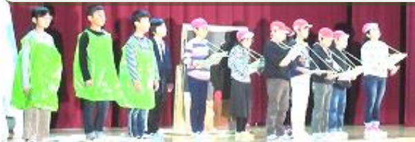
3年 「12人のお店～「いざ、開店」