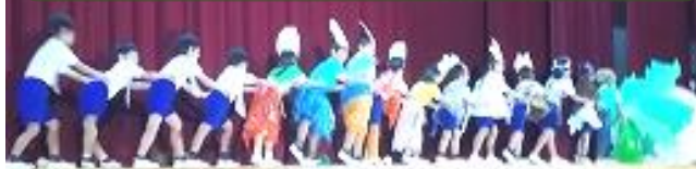
1年 「大きなかぶ ～ちからをあわせて めけるかな～」