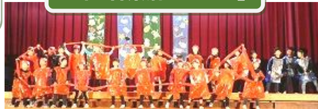
2年 音楽劇「スイミー」