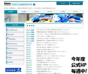
今年度公式HP毎週中!