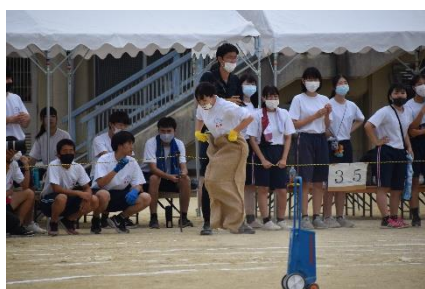
障害物競走(体育祭)