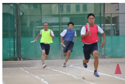
色別対抗リレー(体育祭)