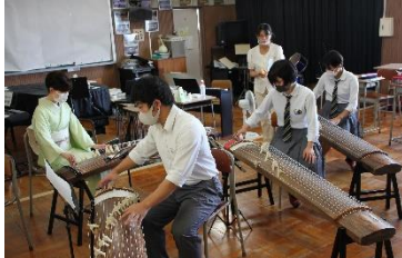
音楽Ⅲの取組 琴体験