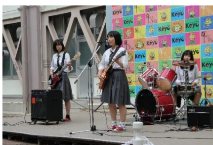
フォークソング部(KCC)