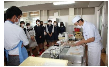
フードデザインの取組 和菓子作り