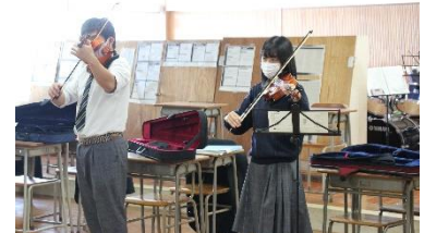
ヴァイオリン体験