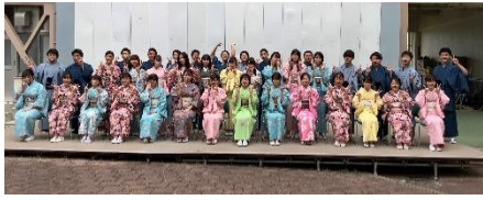
国語科の取組 着物着付け教室