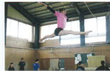
常設の体操競技場