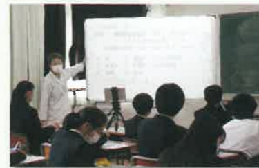
電子黒板を使用した授業