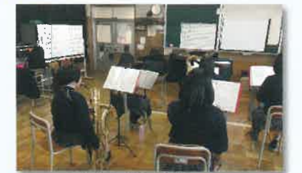
吹奏楽部の練習風景