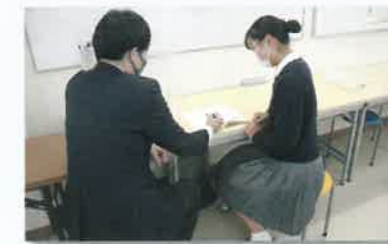
職員室前の質問スペース