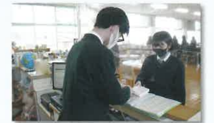
図書委員会の活動風景