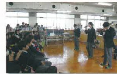
フォークソング部による図書館ライブ