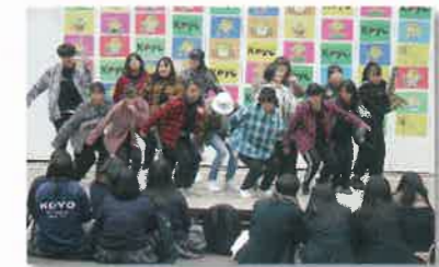
ダンス部による中庭パフォーマンス