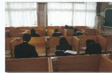
木製ブースの自習室