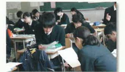
ペアワークでの学び合い