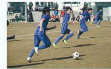
広いグラウンドで部活動