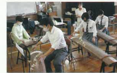
質の高い実技指導