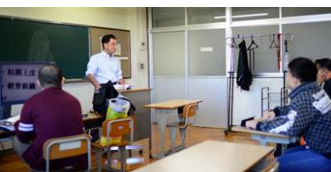
<拡大読書器の使用>