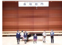
<京都府高等学校 総合文化祭参加 (合唱部)>