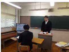
<拡大読書器の使用>