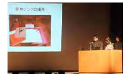
「みらい学Ⅱ」研究発表会