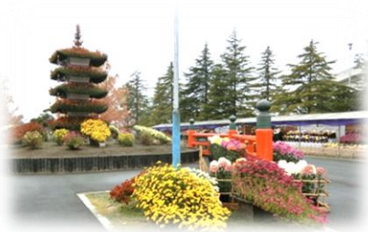
丹波自然運動公園『菊花展』展示