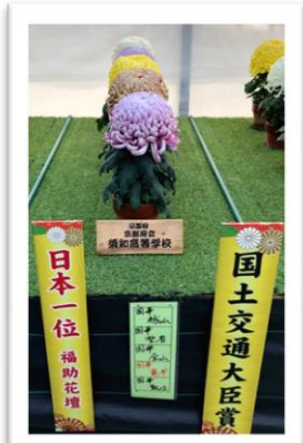
須知高校学校の作品