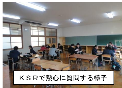
KSRで熱心に質問する様子

さらに、今回からKSR（Komono Study Room）の名称で質問教室を開室しています。昨日は延べ10名の生徒が利用していました。昨日は教師も6名体制で、解らないところを丁寧に教えるように心掛けています。テスト後も、自主的に質問ができるよう定期的な開室を考えています。たくさんの生徒が利用し、解らないところが、「わかった」「理解できた」という実感を持ち、学習に前向きになってくれることを願っています。