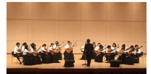
第35回全国中学高等学校 ギターマンドリン音楽祭 金賞および音楽賞受賞