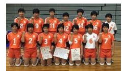
★近畿大会 第3位 女子バレーボール部