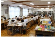
←2年生の学習合宿の様子