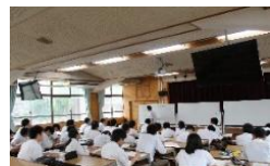
↑1, 3年生のサマーセミナーの様子

夏休みも生徒たちは、学習に励んでいます。1、3年生のサマーセミナー参加者は学校で授業を受けています。2年生は聖護院御殿荘で学習合宿に参加しました。進路実現に向け、一日一日を大切にしています。