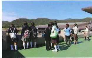
昨年度の学校説明会の様子