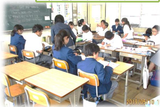
中間テスト前に実施した放課後学習会のようす