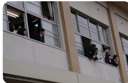
本校での応援の様子