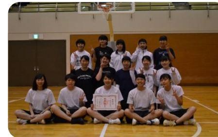
バスケットボール部女子