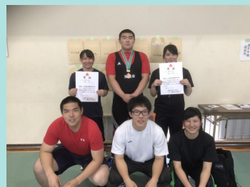
ウェイトリフティング部

また、すでに全国総合文化祭出展が決まっている書道部の1名を含め、5名の生徒が全国大会での活躍を決意し、日々練習に励んでいます。健闘を祈ります。今後とも御声援をよろしくお願い致します。