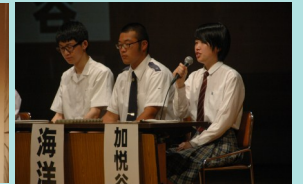
合同説明会の様子