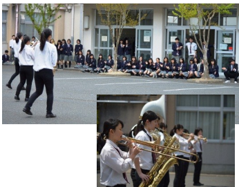
4月19日(火) 昼休み校庭 吹奏楽部 新歓コンサート

Web サイトもご覧ください http://www.kyoto-be.ne.jp/kayadani-hs/