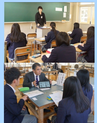
分野別に説明を聞く3年生

分野としては、4年制大学から就職までの多様な講座を設定しました。希望進路実現に向け、どの会場でも真剣な面持ちで講話を聞いていました。