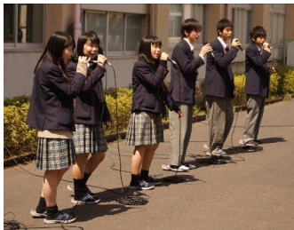
4月14日(木) 昼休み中庭で 合唱部 新歓ライブ