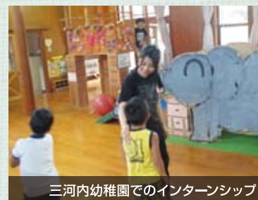
三河内幼稚園でのインターンシップ

保育職と介護職を目指す生徒は、夏季休業中にインターンシップ(就業体験学習)に参加します。生徒は、将来就きたい職業を実際に体験することによって、「あこがれの職業」を「仕事としての職業」として捉え、仕事の大変さを実感することができます。