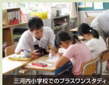
三河内小学校でのプラスワンスタディ

夏休みなど、長期休業中に実施される小学校の学習会に本校の生徒が向いて、学習補助員として学習のお手伝いをします。将来、教員志望の生徒が「教える」ことの大変さと楽しさ、「わかる」喜びなどを体験し、教職への意欲を促します。