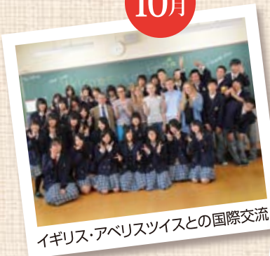
イギリス・アベリスツイスとの国際交流