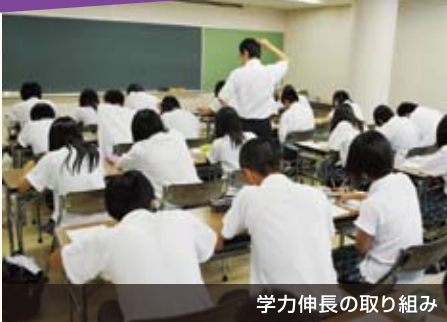
学力伸長の取り組み