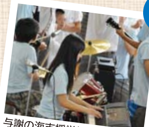
与謝の海支援学校との交流会