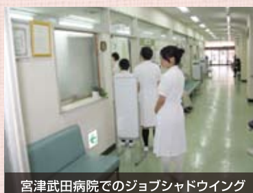
宮津武田病院でのジョブシャドウイング

職場で実際に働いている人に影のように寄り添い、業務を観察する実習です。生徒は業務に参加しませんが、広範な業務を観察することができるため、業務全体を把握しやすくなります。平成25年度は宮津武田病院にご協力いただき、看護職のジョブシャドウイングを実施することができました。