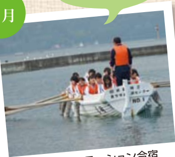
新入生オリエンテーション合宿