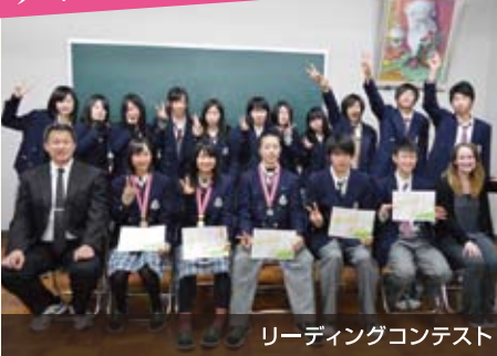
リーディングコンテスト