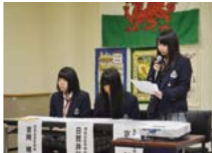
イギリス・アベリスツイス留学報告会