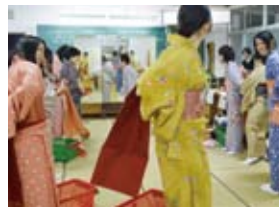
PTA 伝統行事「きもの着付け教室」