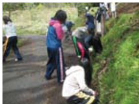
ボランティア活動