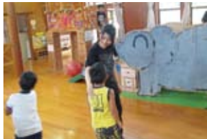
三河内幼稚園でのインターンシップ

夏休みなど長期休業中に実施される小学校の学習会に、生徒が出向いて、学習補助員として学習のお手伝いをします。将来、教員志望の生徒が「教える」ことの楽しさや「わかる」喜びを体験し、教職への意欲を促します。