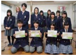
リーディングコンテスト