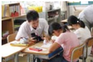
三河内小学校でのプラスワンスターディ

地域の職業人を学校に招いて、自分の職業や人生について語ってもらうキャリア教育授業です。「地域人」に身近な距離感の中で「生きること・働くこと・学ぶこと」について語ってもらい、職業観や勤労観を高める機会とします。