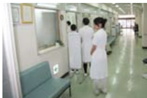
宮津武田病院でのジョブシャドウイング

保育職と介護職を目指す生徒は、夏季休業中にインターンシップ(就業体験学習)に参加します。生徒は、将来就きたい職業を実際に体験することによって、「あこがれの職業」を「仕事としての職業」として捉え、仕事の大変さを実感することができます。