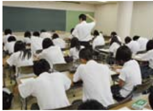
学力伸長の取り組み

与謝野町の文化・歴史を活用し、地域と連携した取組で学習への動機づけと将来への夢を育みます。また、全国・世界レベルの部活動を更に活性化し、世界で活躍する人材を育てます。