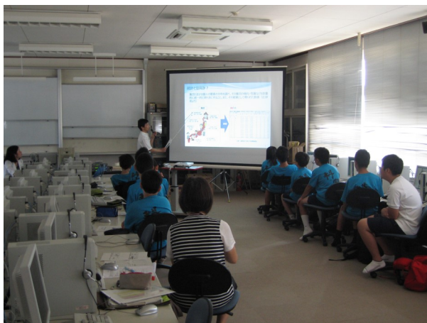
「統計とは何か」の説明風景