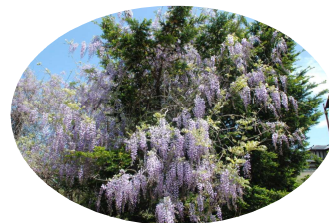
グラウンドの藤の花が見事に咲き始めています。

令和3年度より新学習指導要領の全面実施により、評価の方法や定期テストも変わります。