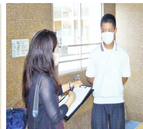
作業の様子が7月4日の京都新聞山城版に掲載されました