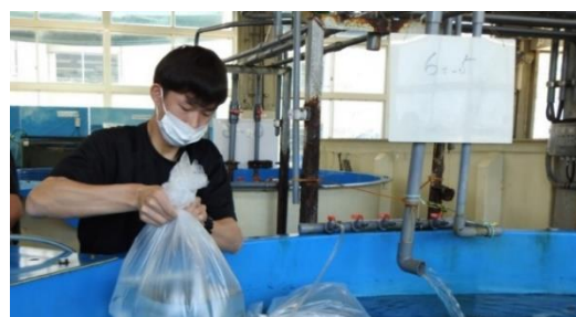
入荷は3年生が行いました。