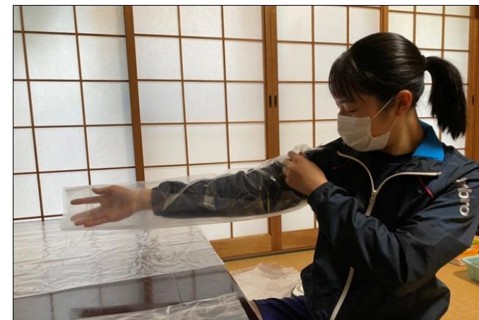
有志で情報交換しながら作業を進めました。