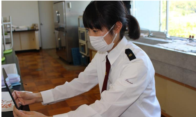
感染症拡大防止を最優先に Web ミーティングを行っています。

4月20日(月)～5月22日(金)の臨時休業期間中、本校では動画配信サイトを用いて、授業内容を生徒たちに配信していました。普通教科では、「スタディサプリ」の講義内容を指定し、専門教科では、教材を送付したり、先生たちが独自に撮影した動画を配信したり