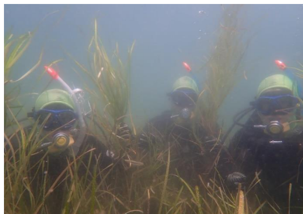
これまで培ってきたダイビング技術を駆使して作業を行います。

新型コロナウイルス感染症の対応のため、一部の医療現場では物資が大変不足し、深刻な状況になっていることが報道されました。海洋科学科には、水産・海洋系その他、さまざまな希望進路の生徒が集っています。その中で、臨時休業中、医療・看護系への進学希望者有志3名が、医療用簡易ガウンを手作りできることを知り、約20着を作製して医療機関に寄贈しました。今しかできないことを考えて実行することができました。