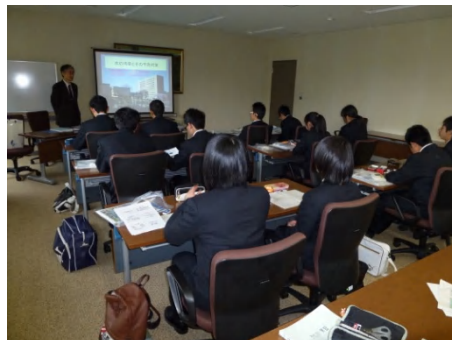
水の浄化についての講義