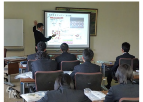
食品の機能性についての講義