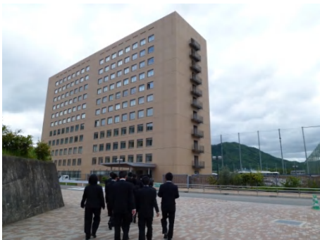
京都学園大学バイオ環境館