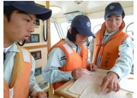
緯度・経度の確認