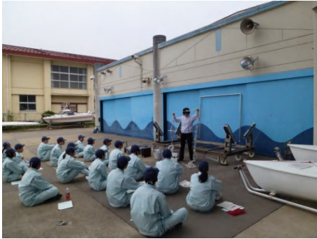
海洋観測機器の説明

5月9日(水)～11日(金)、2年海洋科学科の生徒がキャリアトライアル(集中実習)に取り組みました。5月9日・10日の2日間は、実習船「かいよう(19トン)」に乗船し、海洋観測実習を行いました。最終日には京都学園大学を訪問し、進路意識を高めることができました。