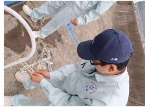
ロープワークの確認