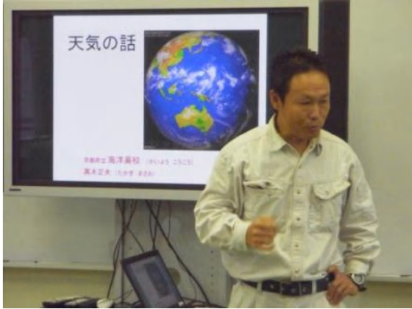
【高木先生出前授業】 「天気の話」をしましょう