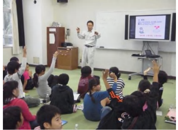
実験の結果を予想してみよう