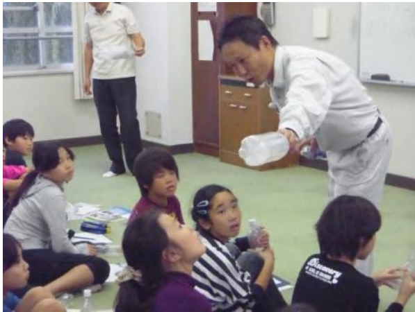
雲ができる前の様子確かめておこう