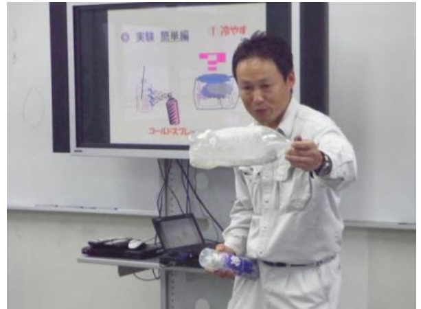
ペットボトルの中に雲を作ってみました