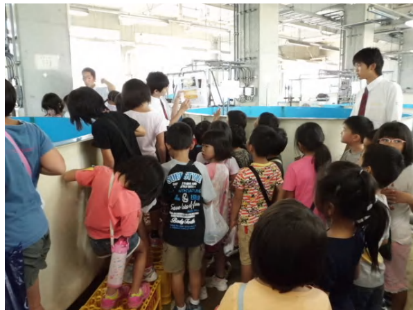
ヒラメ と トラフグ 育てかたをせつめいします