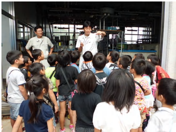
小学校1・2年生 まずは 魚のエサの話から