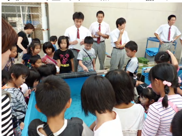
いつもより わかりやすく ていねいに 話す高校生