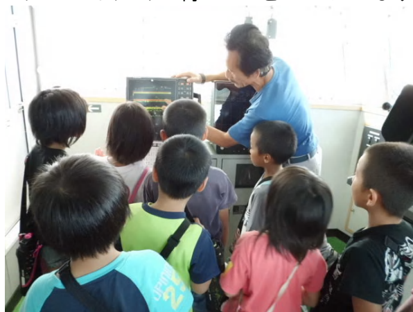
海のふかさ 魚のむれ が レーダーにうつります