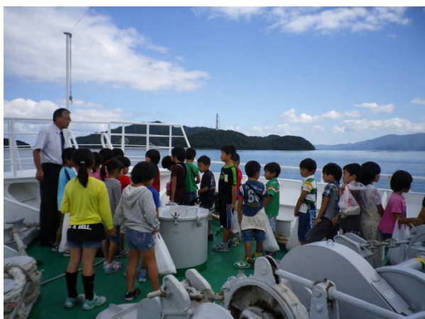
船の中は めいろのようでした