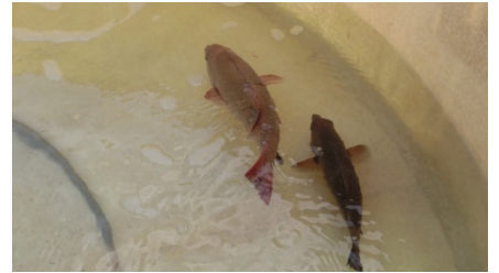
[ 収容 ]