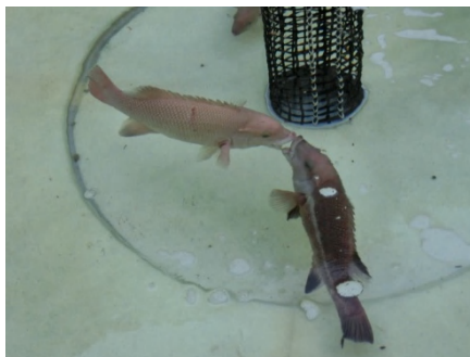
[ 戦闘開始 ]