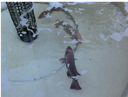
[ にらみ合い ]

喧嘩をするだろうと思いながら、展示水槽のコブダイを先日採捕したコブダイを収容している水槽へ移しました。展示水槽のコブダイの方がやや小さいため、喧嘩に負けて大人しくなると思ったのですが――。