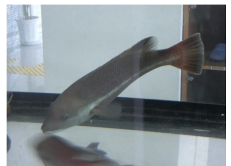
[ コブダイ ]