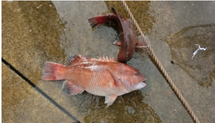
[ 採捕 ]

カゴによる魚類相調査で、よく肥えたコブダイのペアが採捕されました。ハダムシが寄生していたので淡水浴を行って水槽に収容しました。