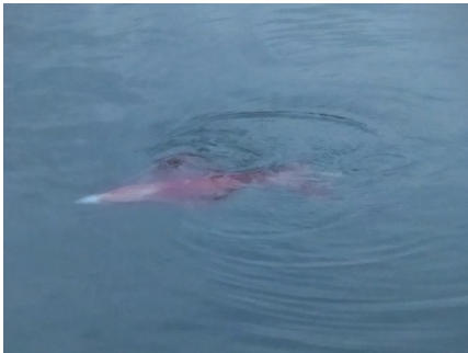
[ 栈橋内を彷徨うソデイカ ]

11月に入り、海洋栈橋ではソデイカ（通称タルイカ）を良く見かけるようになりました。そして今年も死滅回遊魚のアミモンガラがやってきました。熱帯魚のソラスズメダイも見られます。