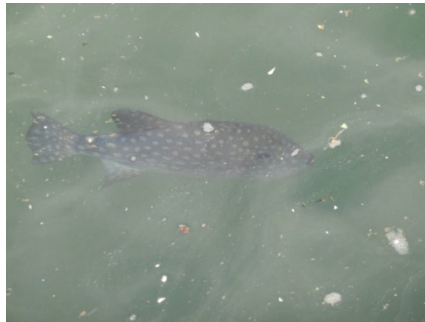
[ 漂流するアミモンガラ ]