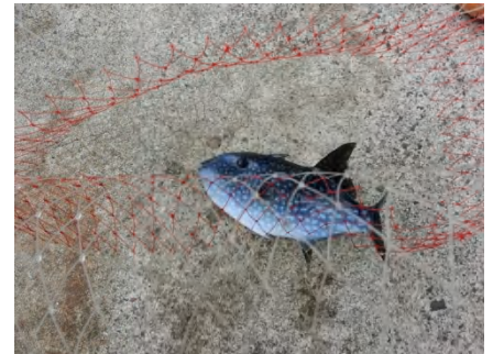
[ アミモンガラ採捕 ]

ソデイカには逃げられましたが、水温が下がり、弱っているアミモンガラは採捕しました。この日は潮流と風向きの関係で海洋栈橋付近に多くのアミモンガラが漂着していました。かなり弱っていたため上手くいくかは分かりませんが、飼育にチャレンジしてみます。アミモンガラは以前も飼育していましたが、ヒータートラブルにより死なせてしまいました。かなり水を汚す魚なので頻繁な換水を必要とします。濾過容量が大きな水槽であれば、人にも慣れるので飼いやすい魚かもしれません。