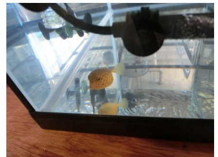
[ ハコフグ ]

現在、以前採捕したハコフグといっしょに飼育していますが、よく横転しているのが心配です。