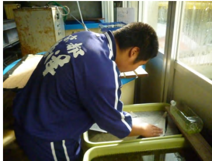
[ 新聞紙を浮かべる ]