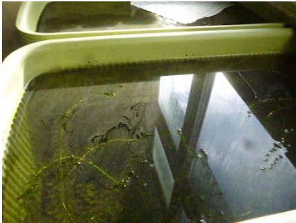
[ 藻類の繁殖 ]

メダカ水槽の水面に、うっすらとアオコのような藻類が繁殖しているため、新聞紙を使って除去しました。種苗生産では油膜除去のために行われている方法です。上手くいきました。