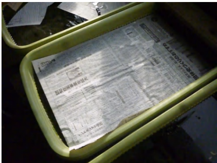
[ こんな感じです ]