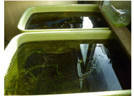
[ きれいになりました ]