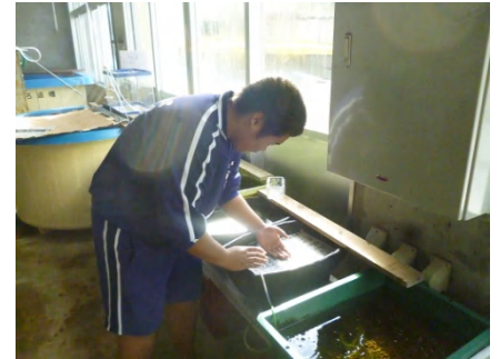
[ 敷きつめる ]