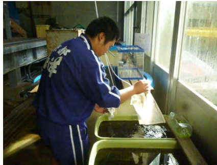
[ 新聞紙の撤去 ]