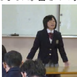
発表の様子(航海船舶コース)