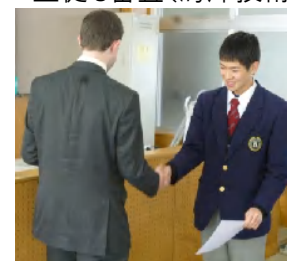
受賞式(海洋技術コース)