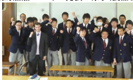
終了後の達成感(栽培環境コース)