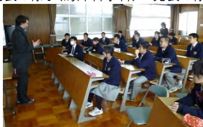
ロバート先生の好評(海洋科学科)