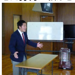
発表の様子(海洋科学科)

(訳)全ての生徒が極めて上手に暗誦しました。全体にどの生徒も発音やイントネーションが素晴らしかったです。また、記憶に残るジェスチャーやパフォーマンスもありました。生徒全員が、それぞれのパフォーマンスに向けて見せた努力に私はとても感動しました。皆さんの健闘を讃えます！