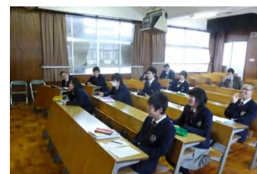
生徒も審査(海洋技術コース)