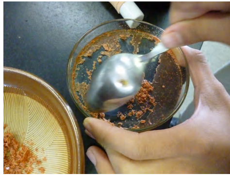
[ 乾燥させる ]