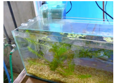
[ シロメダカのような体色の楊貴妃(11月1日) ]