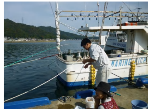
[ 海釣り教室の様子 ]