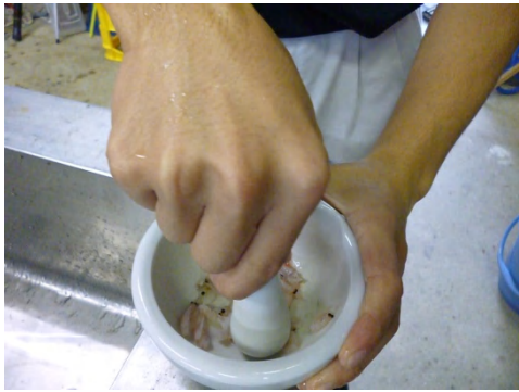
[ すり潰す ]

楊貴妃(メダカ)を飼育していますが、品種独特のオレンジから赤の色が出ず、シロメダカに見えてしまうため、色揚げをすることにしました。色揚げのエサと言えば「オキアミ」です。これを塩抜きをしてすり潰し、乾燥させて与えることにしました。