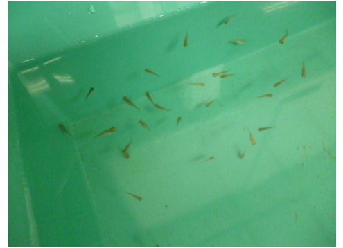
[ ワキンの大小選別 ]