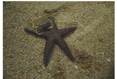
[ モジガイ ]

海水温も上昇し、海洋栈橋では多くの種類の生物を観察できるようになりましたが、昨年多く見られたアイゴを今年はまだ観察できていません。また、カゴ採集調査で多くのコブダイ(幼魚・若魚)が入りました。今までになかったことです。