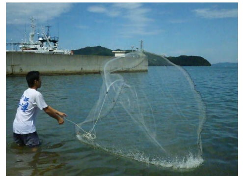
[ 魚類相調査・投網 ]