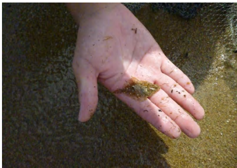
[ マガレイ ]