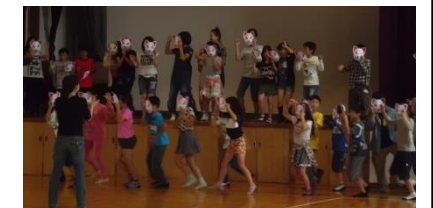
【ワークショップより】