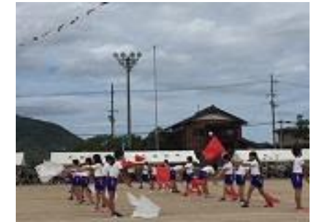
高学年表現運動 Raise your flag