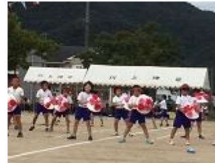
低学年表現運動 花笠音頭

また、地域の代表として、いくつかの競技に参加した児童もいました。また、お家の方や地域の方々と楽しい一日を過ごすことができました。