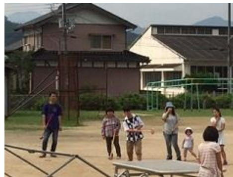
6年生 グラウンドゴルフ