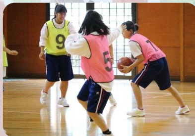
▲女子バスケットボール