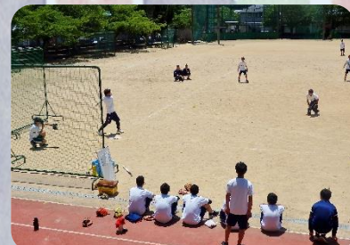
▲男子ソフトボール