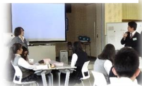
英語プレゼン特別授業

東高は、一人ひとりを輝かせるサポート体制をさらに強化し、きめ細やかな指導を行います。