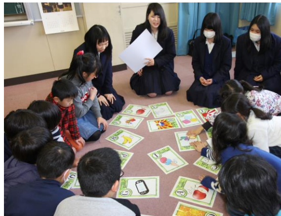
英語かるたをしている様子