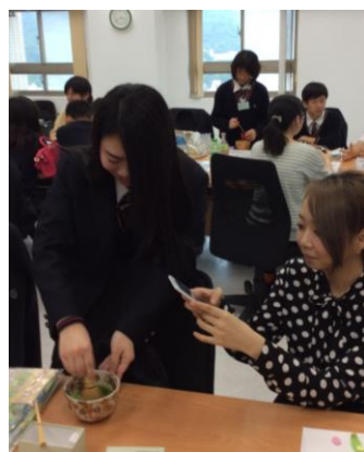
日本の抹茶を振る舞いました