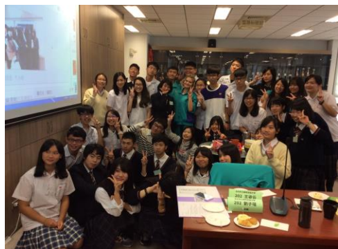
地元の高校生と仲良くなりました。 今でも SNS で交流しています！

国際文化コースの研修旅行は、4泊5日の台湾での研修でした。現地の高校や大学の学生との交流や街頭インタビュー活動などを通して、異文化理解や日本文化に対する理解を一層深めることができました。