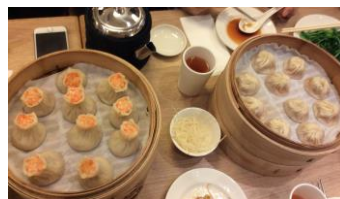
おいしい中華料理の数々