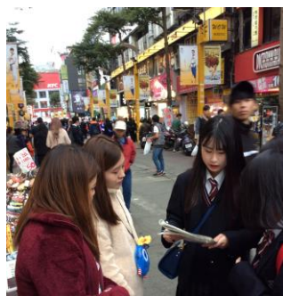
街頭インタビューをしています