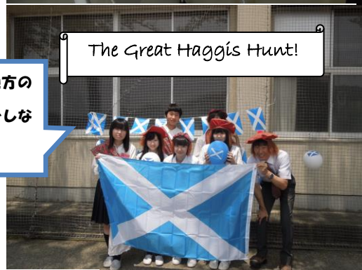
The Great Haggis Hunt!