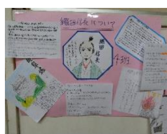
・戦国武将の新聞作成