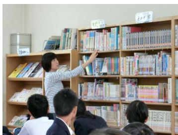
・オリエンテーション