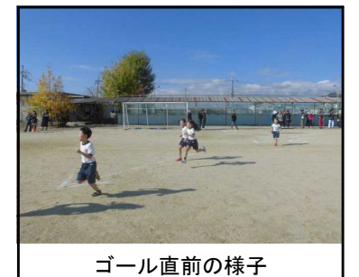
ゴール直前の様子