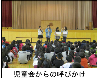
児童会からの呼びかけ

昨日、話し合った内容をクラスの人権宣言として、人権集会で発表しました。また、12月6日（水）の児童集会でクラスでの取り組んだ内容や結果を発表します。