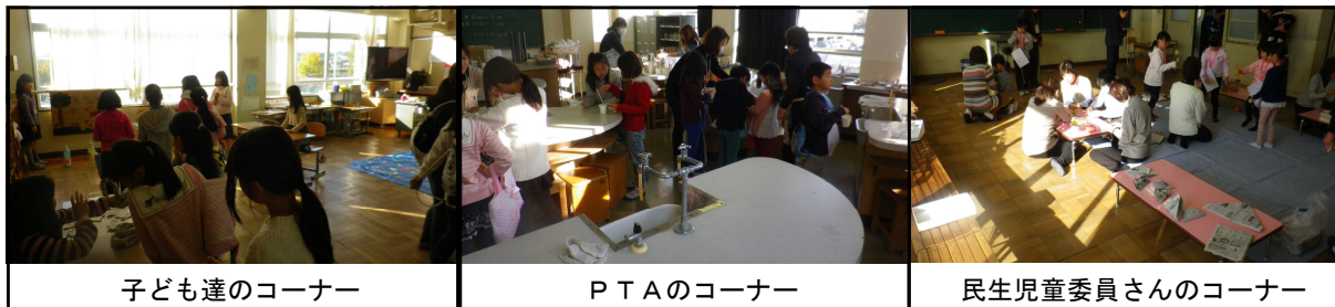
子ども達のコーナー

また、PTAの方には「ストラックアウト」や「スリッパけとばし」「スライム作り」民生児童委員さんにも、「昔遊びなどのコーナー」を担当していただき、多くの方々のお力をお借りして実施することができました。準備から当日の運営まで様々な方々にお世話になりました。