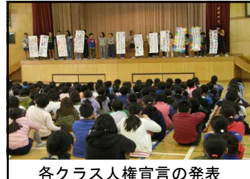
各クラス人権宣言の発表