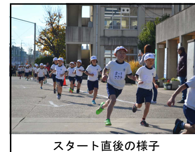
スタート直後の様子