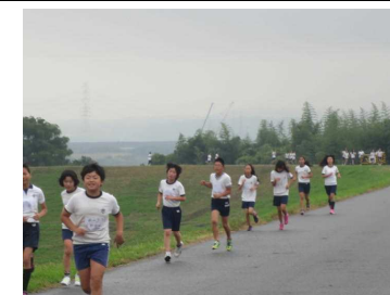
▲木津川堤防の様子