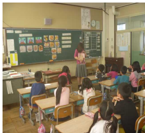
▲2年生におけるの栄養指導の様子

11月24日(木)は、「和食の日」ということで、本校では和食の良さについて知る指導を各クラスで行いました。