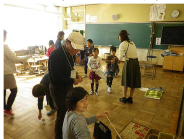
▲民生児童委員さんのコーナー