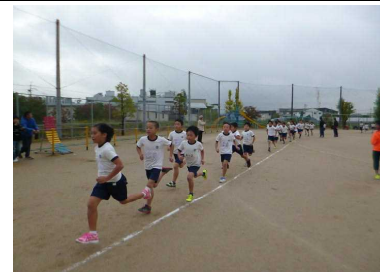
▲ スタート直後の様子