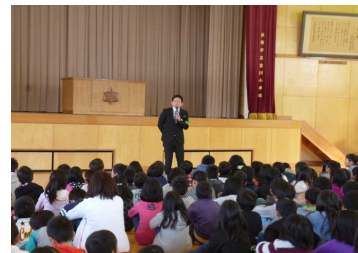
▲警察の方からのお話