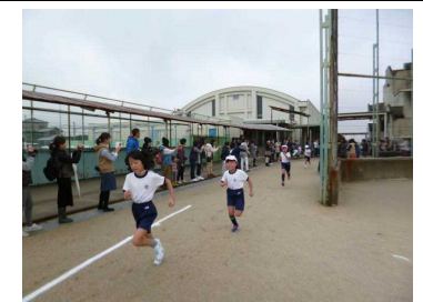
▲ゴール直前の様子