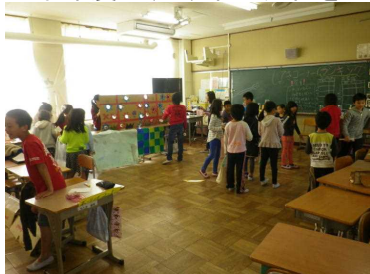
▲子ども達のコーナー