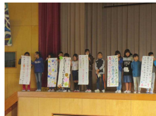
▲人権集会での各学級の「人権目標」の発表風景

話し合った内容をクラスの人権宣言として、人権集会で発表したり、教室や廊下に掲示したりします。また、児童集会でクラスでの取組内容や結果を発表をしたりしていきます。