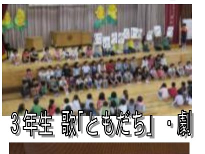
3年生 歌「ともだち」・劇