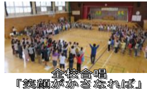
全校合唱「笑顔がかさなれば」