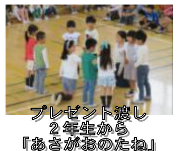
プレゼント渡し 2年生から「あさがおのたね」