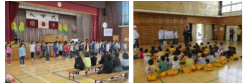
歓迎のことば~2年生~ 1年生下校指導

4月24日(火)、1年生を迎える会がありました。どの学年も素敵な出し物でした。かわいい1年生が入学したことを、全校で歓迎できた素晴らしい会となりました。