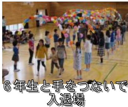
6年生と手をつないで入退場