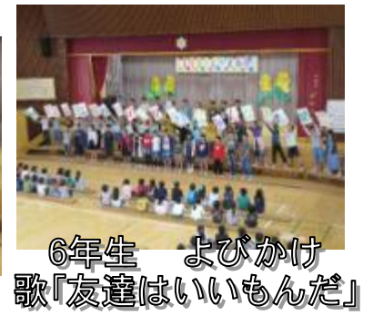
6年生 よびかけ歌「友達はいいもんだ」