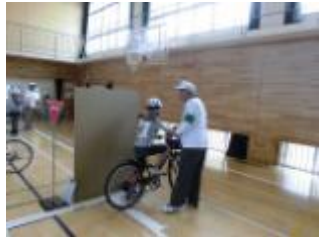
29年度実施時の様子