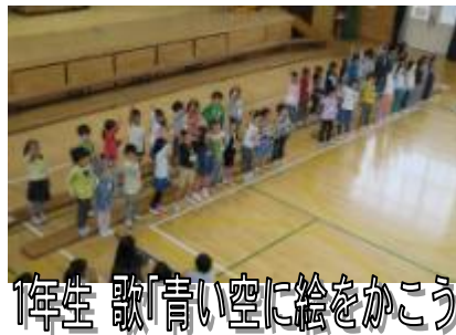
1年生 歌「青い空に絵をかこう」