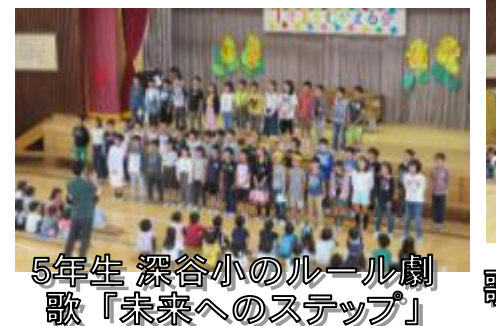
5年生 深谷小のルール劇 歌「未来へのステップ」