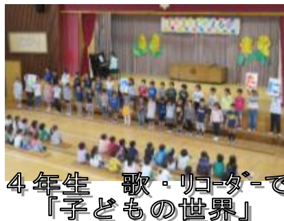
4年生 歌・リコーダーで「子どもの世界」