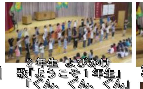
2年生 よびかけ歌「ようこそ1年生」「ぐん、ぐん、ぐん」