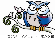
センターマスコット センタ君

平成24年5月16日(水) 第38号(通算第121号) 京都府総合教育センター TEL : 075-612-3266